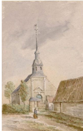
B.M. Abbeville, coll. Macqueron, cote Roi.8

A Vraignes , le clocher ancien datant des années 1700 est resté debout ; la nouvelle église, aux murs en briques, a été reconstruite dans la même disposition que celle d'avant-guerre (bien qu'en retrait par rapport au clocher). L'entrée sur le côté rappelle l'avancée existant autrefois.