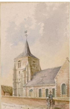
B.M. Abbeville, coll. Macqueron, cote Roi.39

On retrouve dans nos 3 églises le témoignage des orientations de cette époque. Pour ce qui concerne l'apparence extérieure , elles ressemblent aux églises d'avant-guerre comme le montre la comparaison avec les aquarelles peintes en 1875 par Macqueron et conservées à la bibliothèque d'Abbeville.